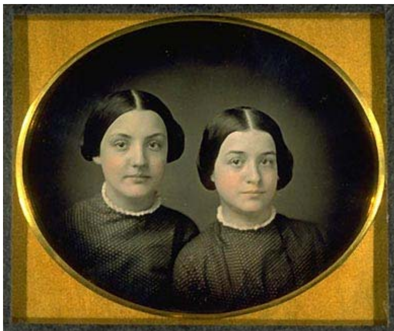
Dagherrotipista non identificato – Sorelle di confessione quacchera Dagherrotipo colorato a mano, Usa 1853 George Eastman House, Rochester, Usa