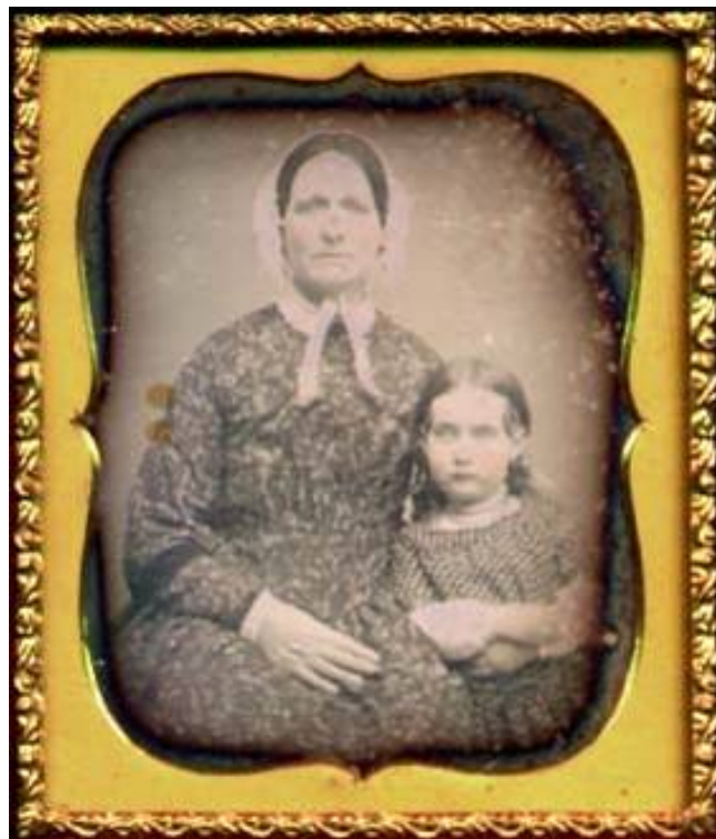
Dagherrotipista non identificato – Madre e figlia, Italia, 1855 ca