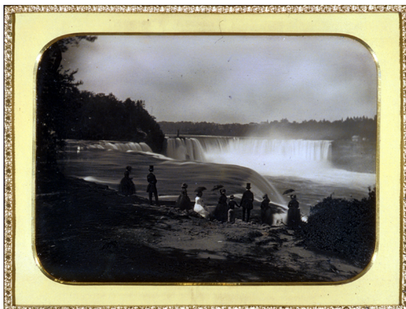
Platt D. Babbitt, Le Cascate del Niagara, Usa, 1855 circa George Eastman House, Rochester, Usa