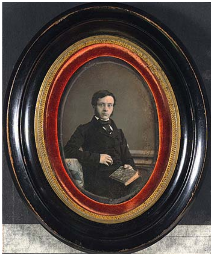
Dagherrotipista non identificato - Ritratto del Generale Giorgio Manin, ante 1849 Museo nazionale di Storia della Fotografia Fratelli Alinari, Firenze