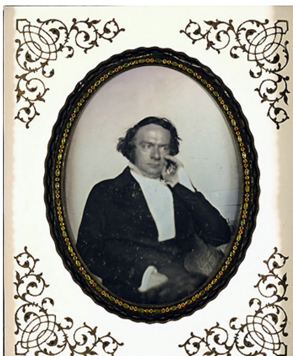
Dagherrotipista non identificato - Ritratto di Vincenzo Gioberti, 1848 Museo nazionale di Storia della Fotografia Fratelli Alinari, Firenze