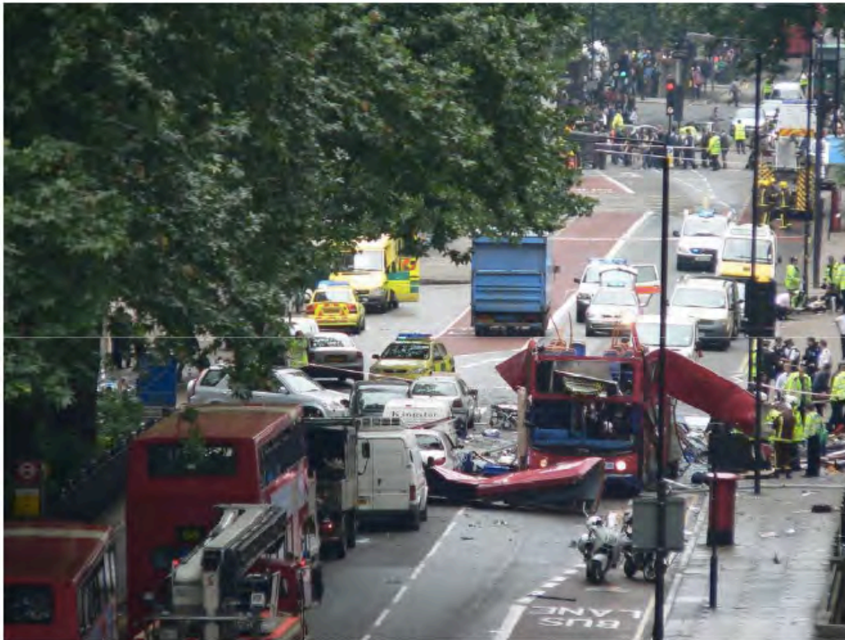
Foto dell'attentato ad un autobus di Londra, Tavistock Square 7 luglio 2005