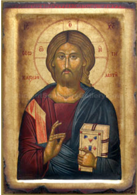
Tipologia di icona bizantina: Cristo

In Oriente dopo la conclusione della guerra delle immagini si sviluppa straordinariamente la pittura delle icone. Le immagini sono frontali, gli sfondi sono monocromi e quasi sempre dorati, gli sguardi fissi, le immagini non hanno profondità e non hanno un contesto (paesaggio, altri personaggi, edifici ecc.)