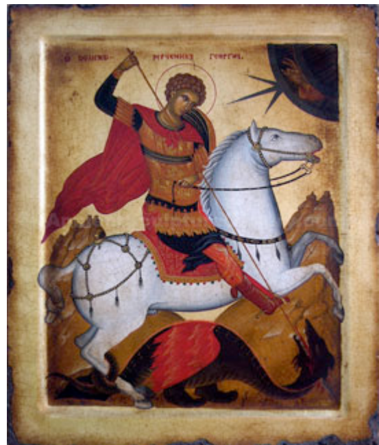
Tipologia di icona bizantina: San Giorgio e il drago