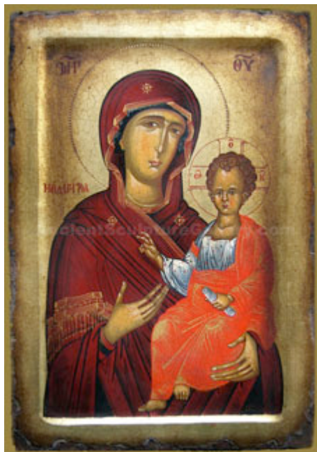
Tipologia di icona bizantina: Madonna con bambino