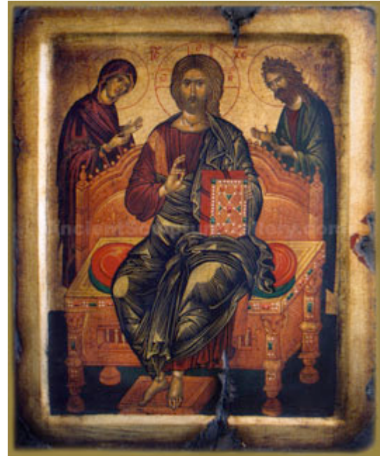
Tipologia di icona bizantina: Cristo, Maria, S. Giovanni Battista