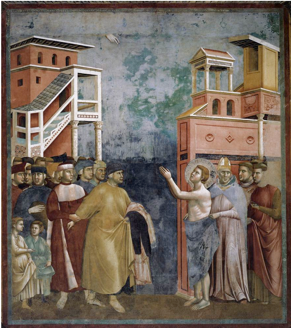
Giotto di Bondone, Rinuncia dei beni, Storie della vita di S. Francesco Assisi, Basilica superiore, 1290 c.

La narrazione di un momento drammatico, l'istantanea di una violenta tensione padre-figlio, una folla di cittadini di Assisi ciascuno caratterizzato a suo modo, gli edifici della città, le case e la chiesa; il momento dell'abbandono della vita laica e mondana da parte di Francesco non potrebbe esse rappresentato con maggiore immediatezza. Il realismo nella pittura occidentale si è ormai liberato di ogni convenzione simmetrica, tende alla terza dimensione, fa vivere i paesaggi e i cieli e rifiuta il fondo oro e la gerarchia dei personaggi. Costruisce racconti, cicli, epopee, sequenze, dotate di una profonda presa sul pubblico popolare.