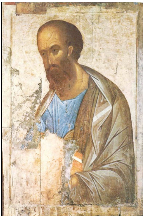
Andrej Rublëv, L'apostolo Paolo , Mosca, Galleria Tretiakov, 1407 ca.