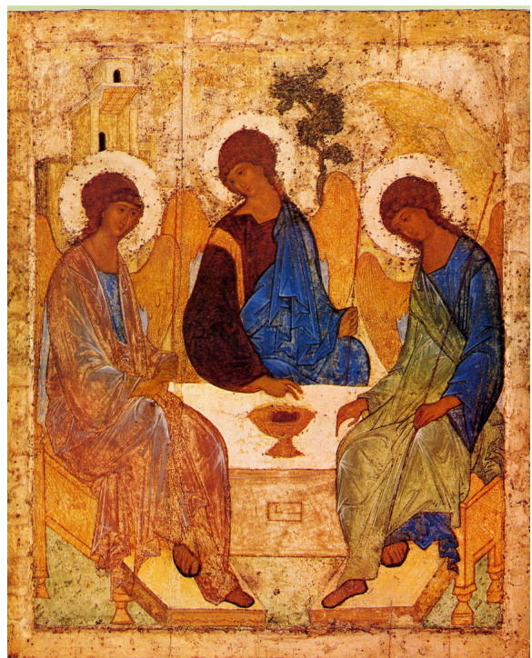
Andrej Rublëv, La Trinità , Cattedrale della Trinità, Mosca, inizio sec. XV