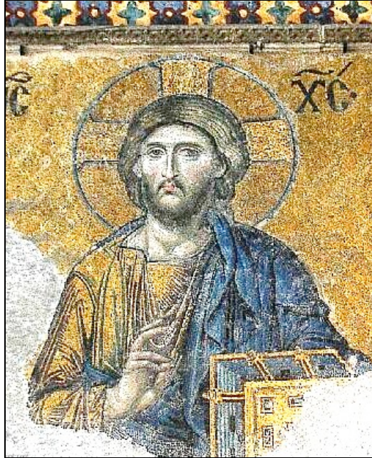
Cristo Pantocrator (sovrano di tutte le cose), Chiesa di Santa Sofia, Costantinopoli

Di questa sottovalutazione cerco di indicare in questo appunto alcune radici storiche e teologiche.