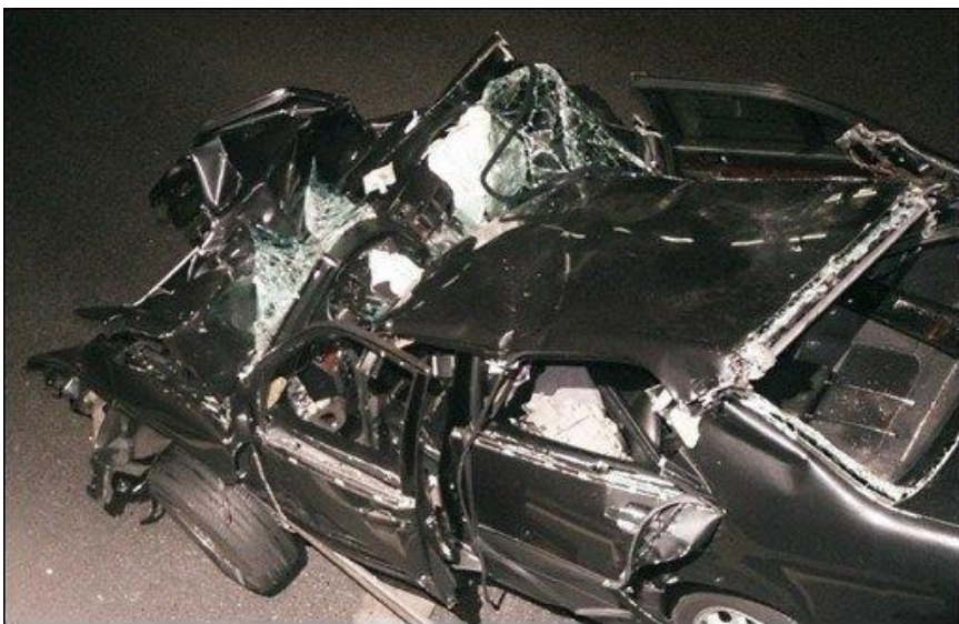
Parigi, Pont de l'Alma. Dopo il 31 agosto 1997