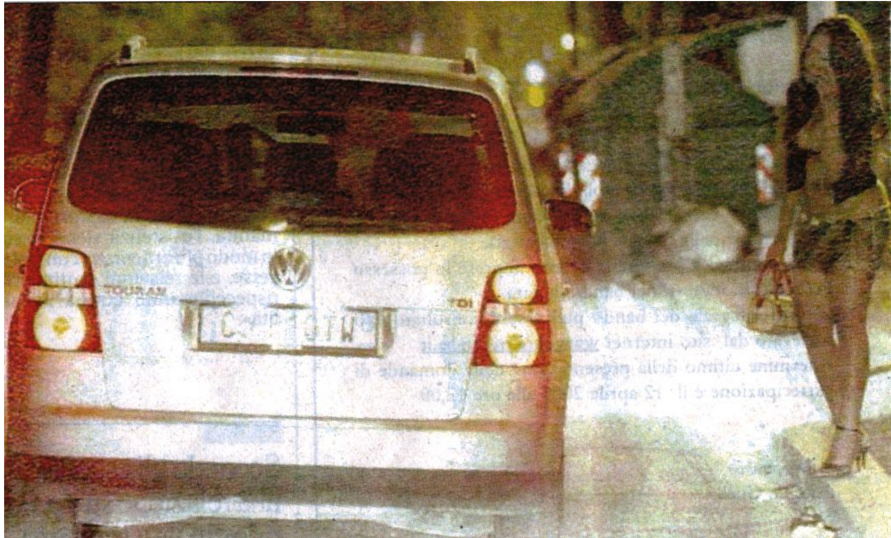
Un politico si ferma in una strada della Roma notturna – (Massimo Scarafone, 2007)