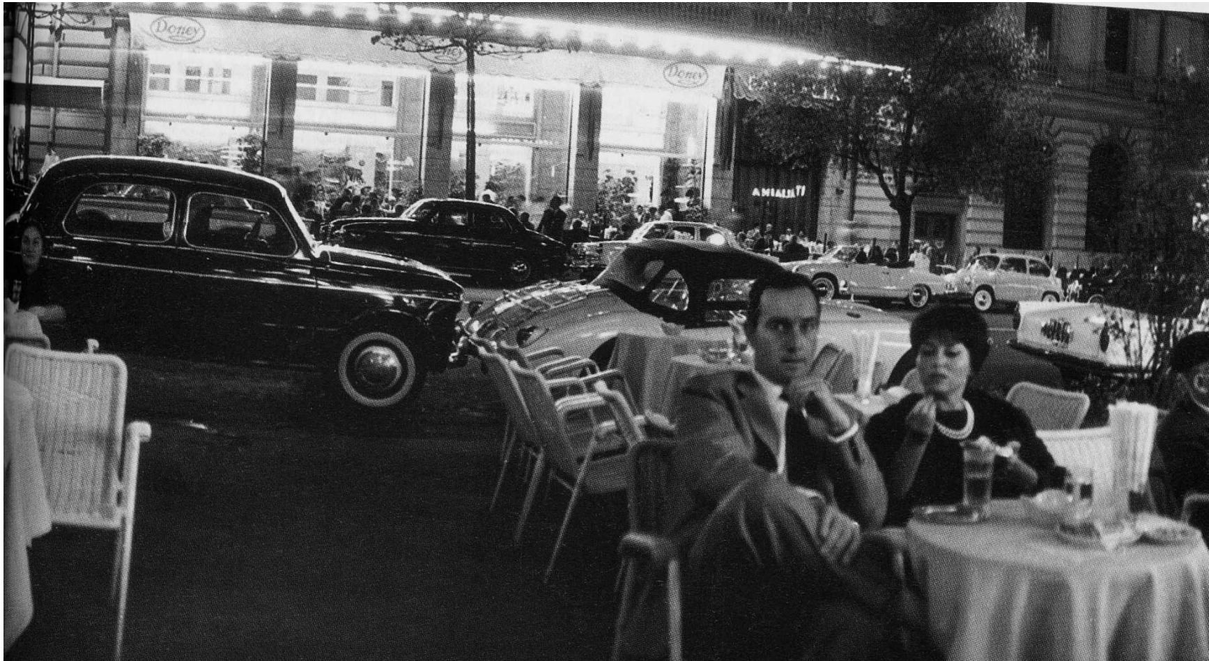
Via Veneto ai tempi della dolce vita