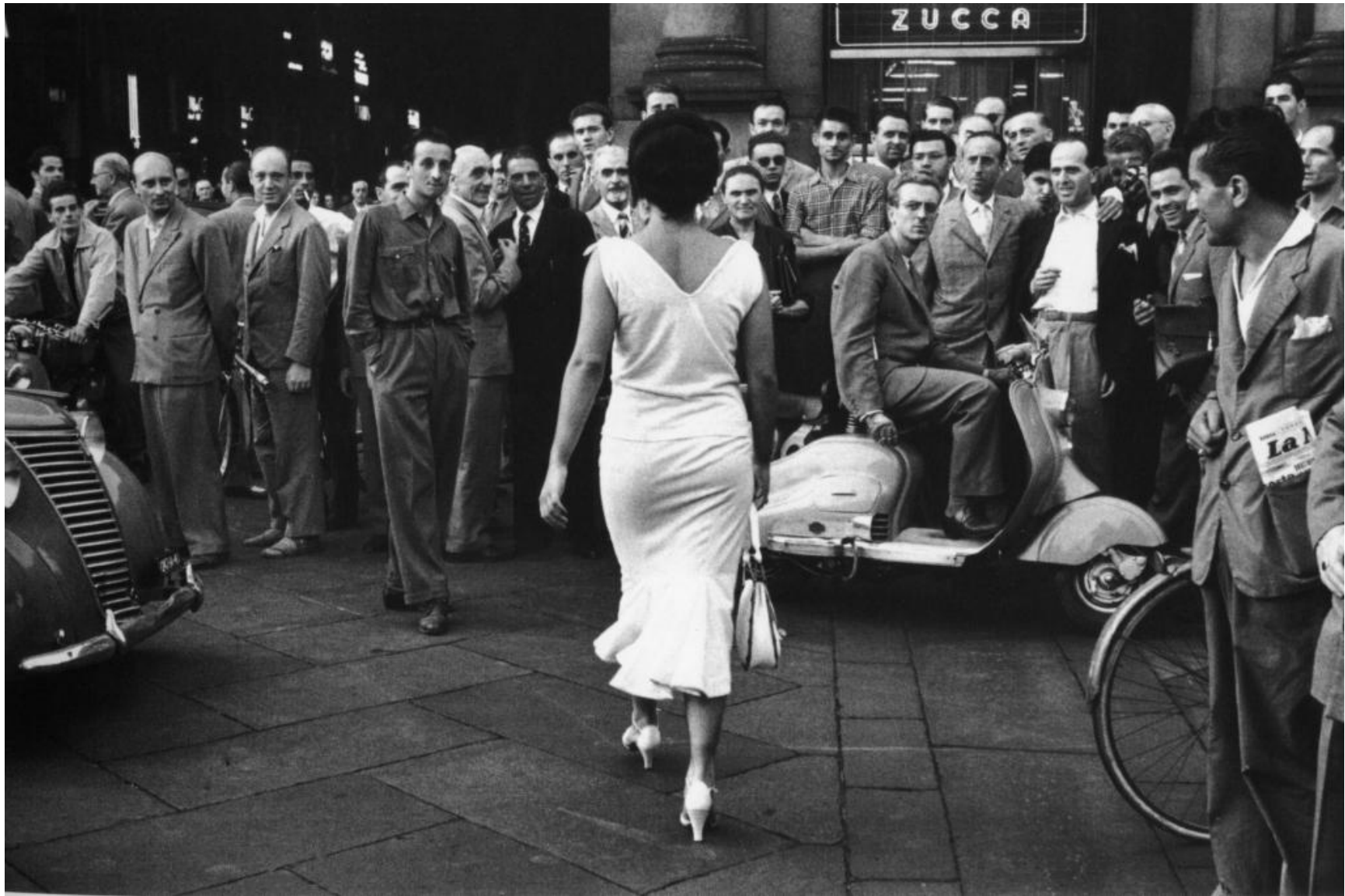
Mario De Biasi, Gli italiani si voltano, 1953