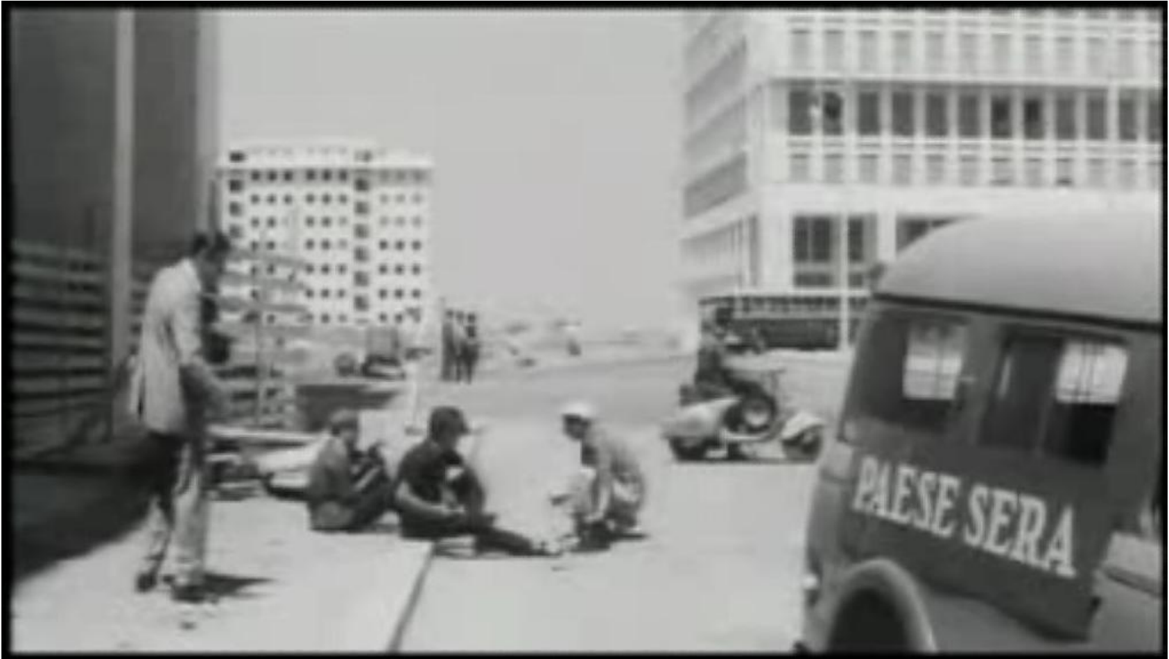
I paparazzi ne "La dolce vita", 1960