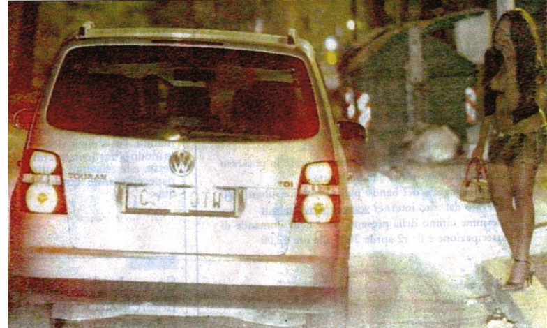
Gli italiani si voltano: 1953 – 2007