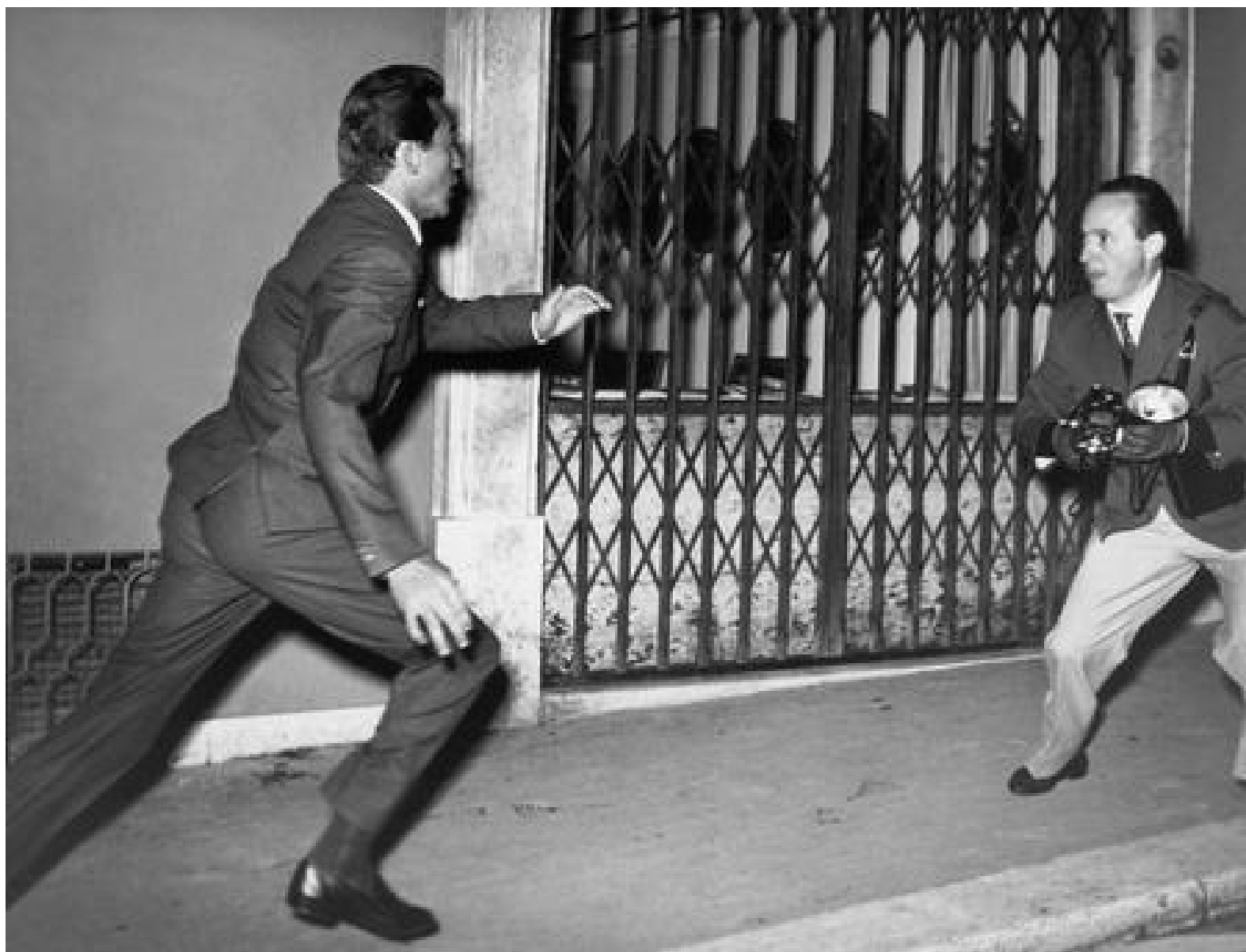
Walter Chiari fronteggia Tazio Secchiaroli