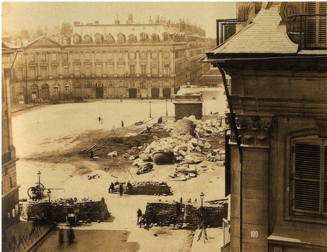
André-Adolphe-Eugène Disdéri, La colonna Vandôme abbattuta, 1871

Disdéri fotograferà Parigi durante i combattimenti della Comune e, dopo la tragica repressione potrà forse, grazie alla sua appartenenza all'establishment conservatore, fotografare i comunardi caduti. Qui mostreremo solo la meno cruda delle immagini scattate in quell'occasione, che gli è attribuita.