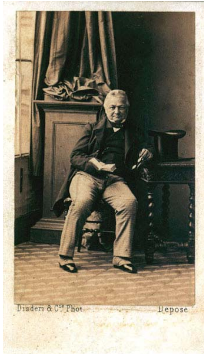
André-Adolphe-Eugène Disdéri, Louis Adolphe Thiers, carte de visite , 1860 c. Potentissimo uomo politico conservatore, che sarà il primo presidente della Terza Repubblica dopo la sconfitta nella guerra Franco-Prussiana e la tragica repressione della Comune di Parigi (1871)