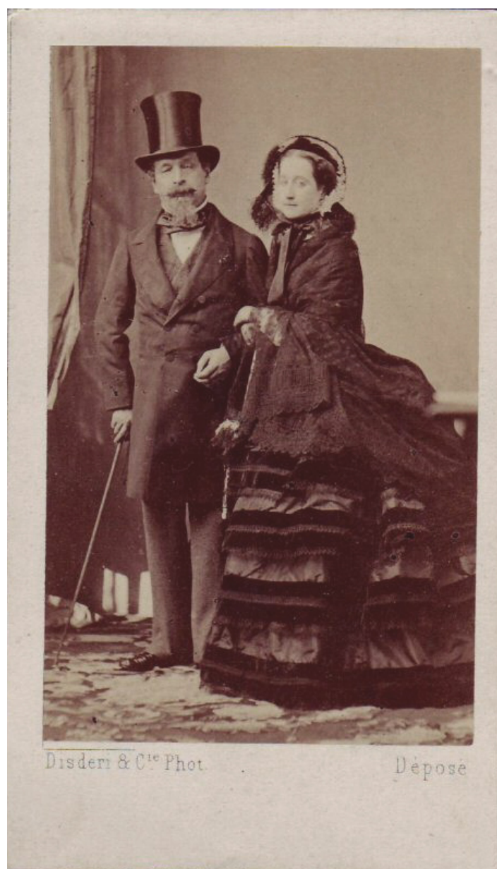
André-Adolphe-Eugène Disdéri, L'Imperatore Napoleone III e l'Imperatrice Eugenia carte de visite , 1865

Fotografato come un qualunque buon borghese, è però l'Imperatore di Francia e si considera un cliente affezionato di Disdéri. Nel 1859, alla testa dell'armata che si recava in Italia per quella che noi chiamiamo la seconda guerra d'indipendenza (1859), aveva fatto fermare le truppe davanti al suo studio per farsi fotografare in divisa militare.