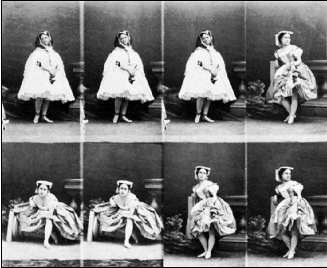
André-Adolphe-Eugène Disdéri, carte de visite , 1855-60 c.