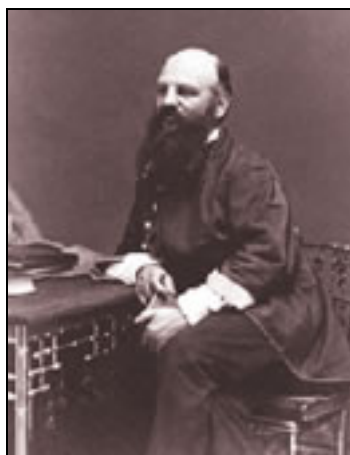
André-Adolphe-Eugène Disdéri, (1819 - 1889)

André-Adolphe-Eugène Disdéri, un fotografo parigino che aveva fatto studi di pittura, apre il suo atelier nel 1854 e nello stesso anno brevetta un procedimento per la carte de visite : una macchina fotografica con quattro obiettivi (successivamente otto o dodici) impressiona contemporaneamente, sulla stessa lastra, altrettanti ritratti di dimensioni ridotte, 5,5 cm x 8,5 circa. È il primo formato standard dell'immagine fotografica. Il soggetto è generalmente ritratto in piedi; le foto sono incollate su un cartoncino rigido che sotto il ritratto presenta spesso il nome del fotografo, e può fornire sul retro varie informazioni aggiuntive: il suo marchio, l'indirizzo dello studio, le medaglie e i premi che ha ricevuto. Sono accessori indispensabili di una intensa competizione commerciale, necessari al riconoscimento del fotografo ma indicativi anche del suo desiderio di "firmare", come artista, la sua opera. La carte de visite è, a tutti gli effetti, un oggetto seriale della società di massa. Costa solo 20 franchi, un quinto di un ritratto fotografico normale, e permette ad un pubblico popolare di crearsi un biglietto da visita, una identità visiva.