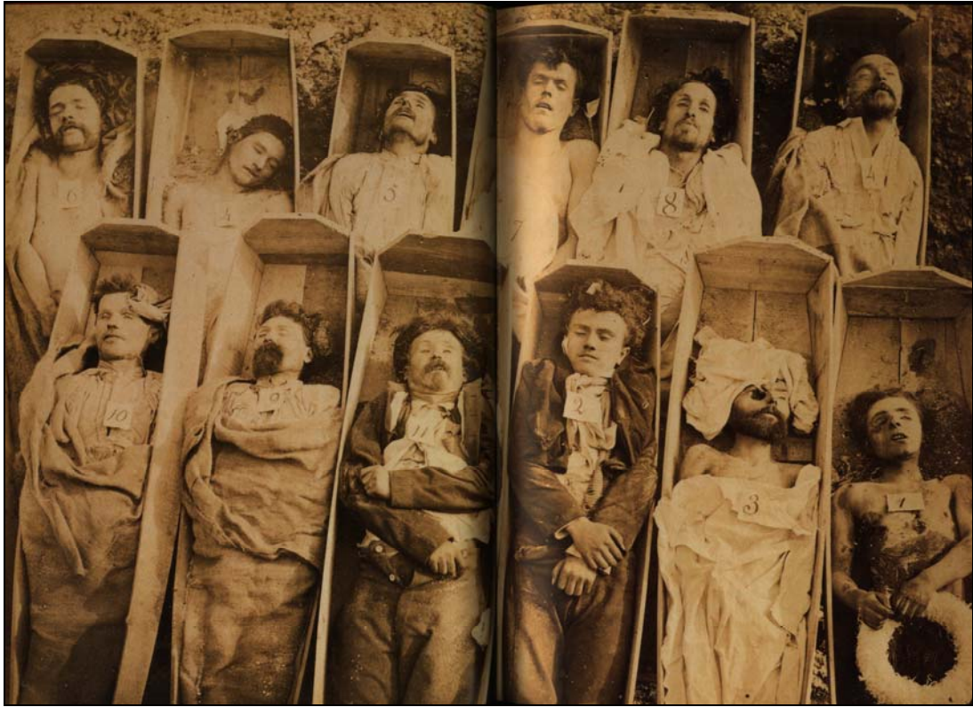
André-Adolphe-Eugène Disdéri (attribuita), Comunardi uccisi, 1871