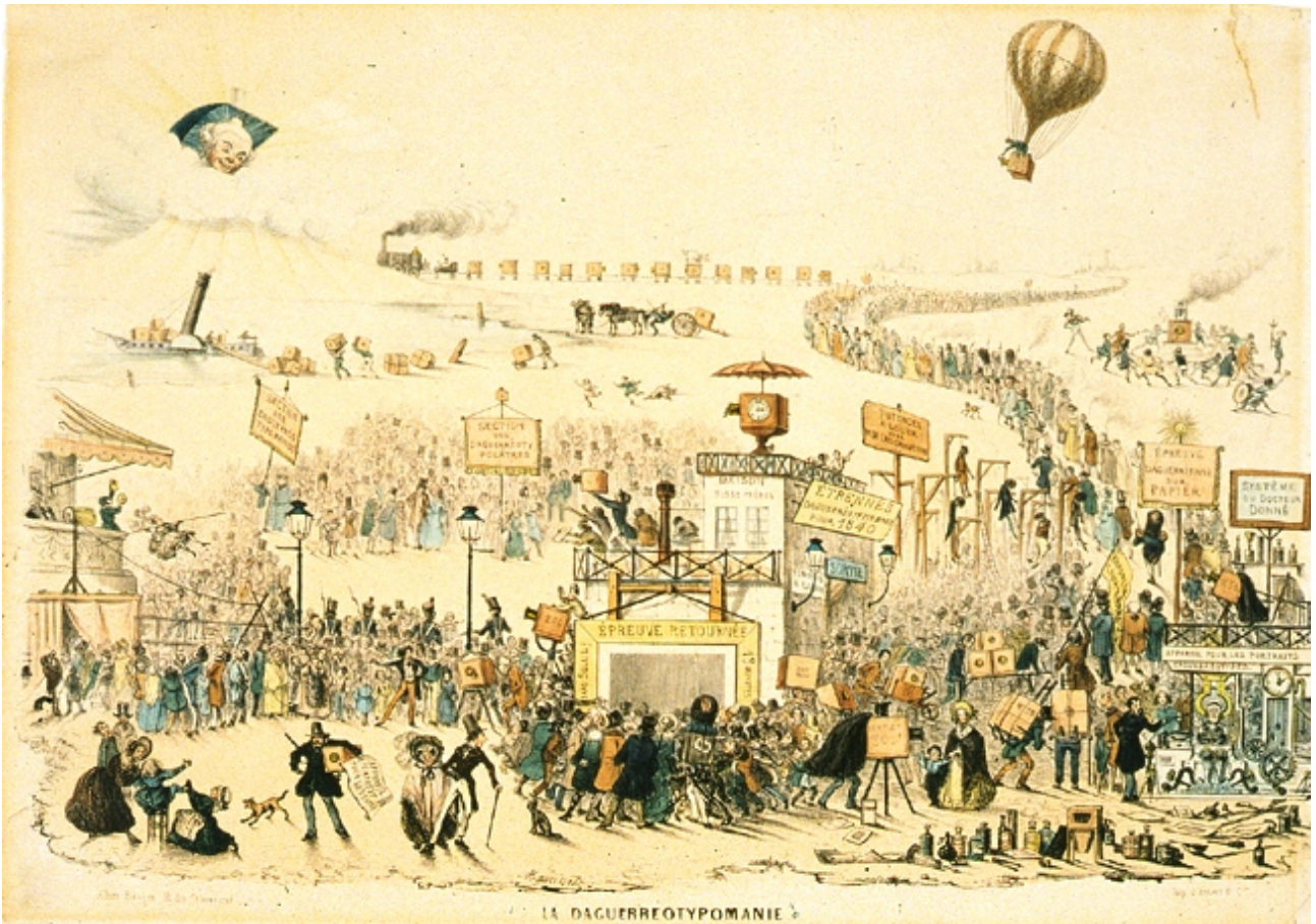
Paul Maurisset, La Daguerreotypomanie. Litografia colorata a mano, Parigi 1839 George Eastman House, Rochester Una felice rappresentazione della nuova moda della fotografia, circondata dai simboli della metropoli e della modernità