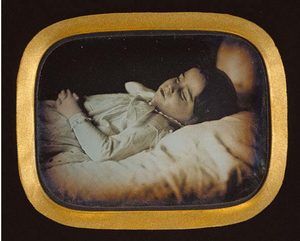
Charles Durheim, Post mortem, Svizzera, 1852 circa Paul Getty Museum, Los Angeles