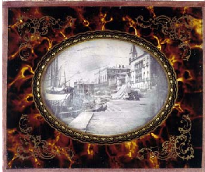
Dagherrotipista non identificato - Venezia, Riva degli Schiavoni, 1848 ca. Monaco di Baviera, coll. Siegert