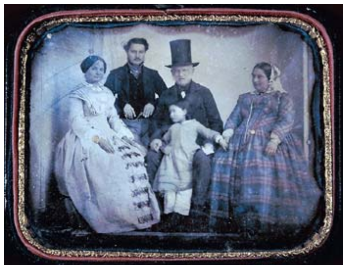
Giacomo Luswergh, La famiglia Luswergh, 1845 circa. Dagherrotipo colorato a mano e incorniciato. Roma, Collezione Fornari Luswergh.