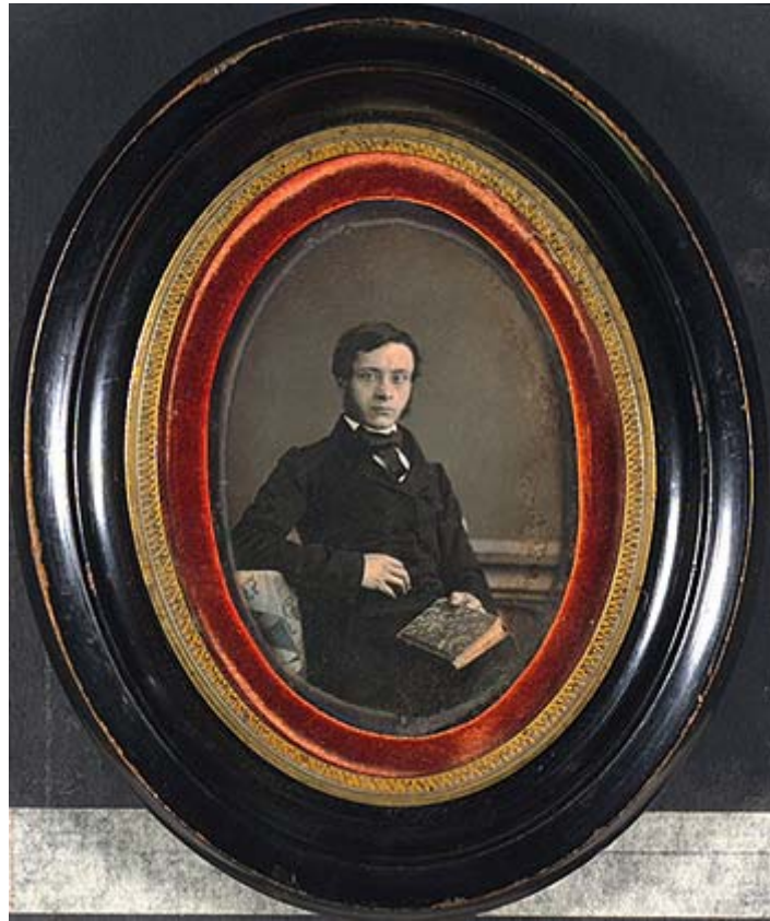
Dagherrotopista non identificato - Ritratto del Generale Giorgio Manin, ante 1849 Museo nazionale di Storia della Fotografia Fratelli Alinari, Firenze