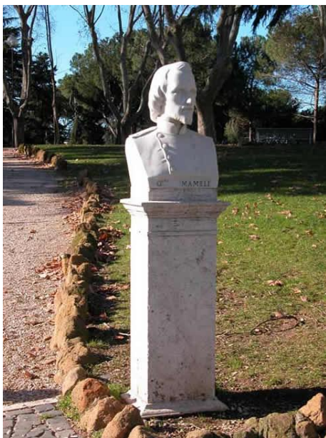
Busti garibaldini sul Gianicolo, a Roma vicino al monumento equestre di Garibaldi