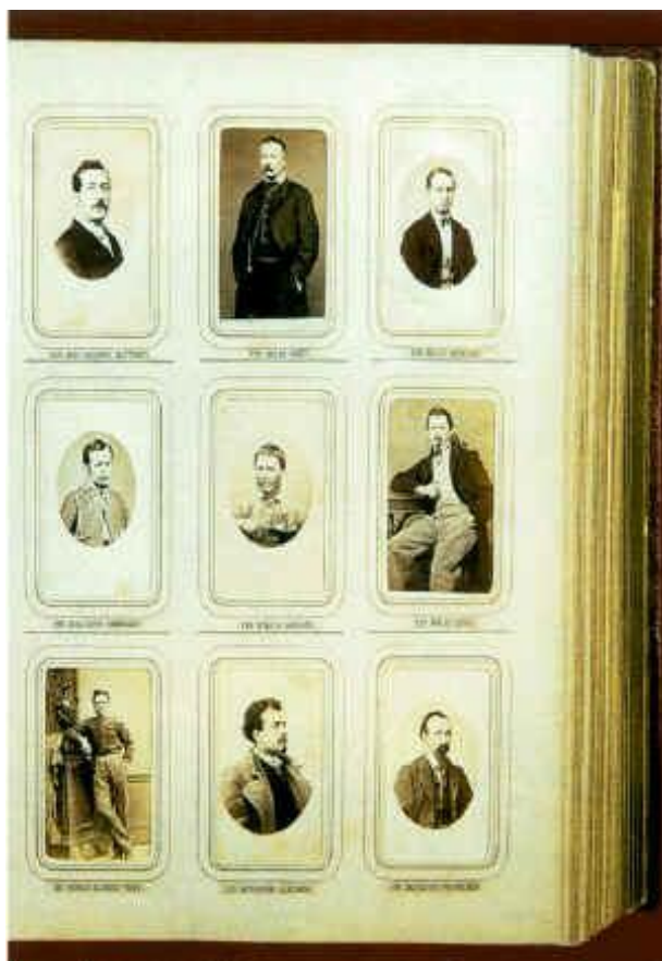
L'Album dei Mille di Alessandro Pavia Nell'esemplare dell'Archivio Comunale di Palermo http://www.comune.palermo.it/Eventi/Arte/Archivio_Storico/Il%20tempo%20ritrovato.htm