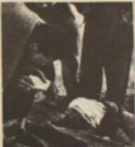
I caduti per la libertà di tutto il mondo in lavoro ancora quello che rimane